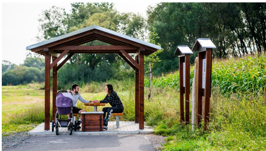
Ilustrační obrázek, IROP