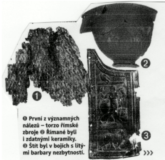
● První z významných nálezů – torzo římské zbroje ● Římané byli i zdatnými keramiky. ● Štít byl v bojích s litémi barbary nezbytností.