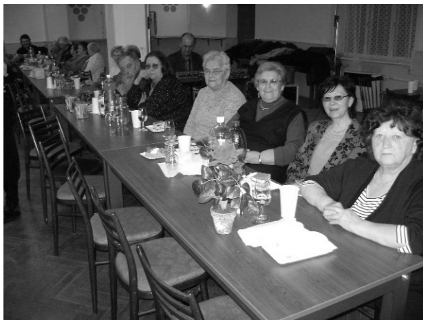
Obr. : Posezení s důchodci