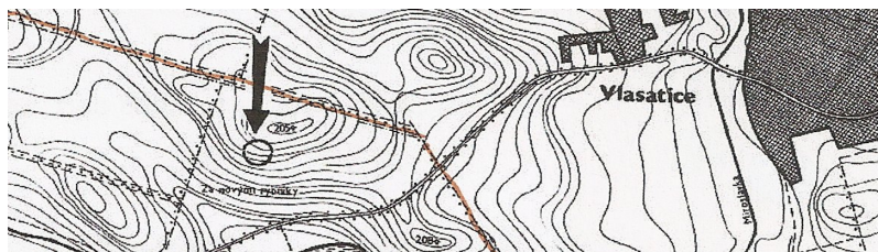
Obr. : Troskotovice – „Ve strání“. Situační plán lokality.