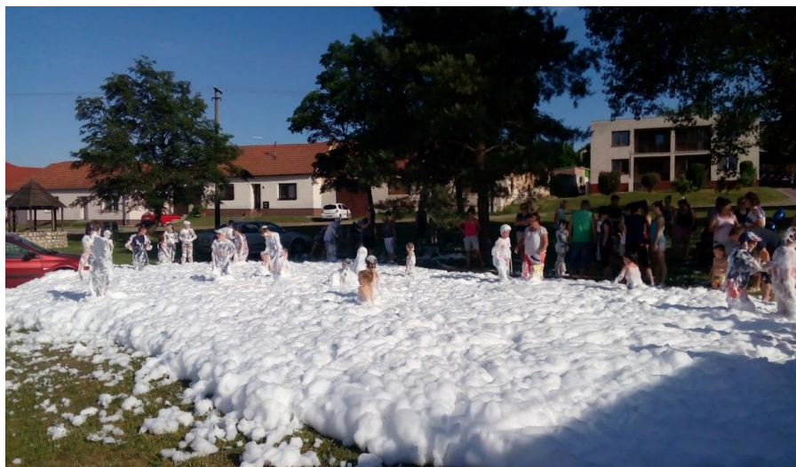
Foto: Pěnové hrátky na dětském dni v Troskotovicích.