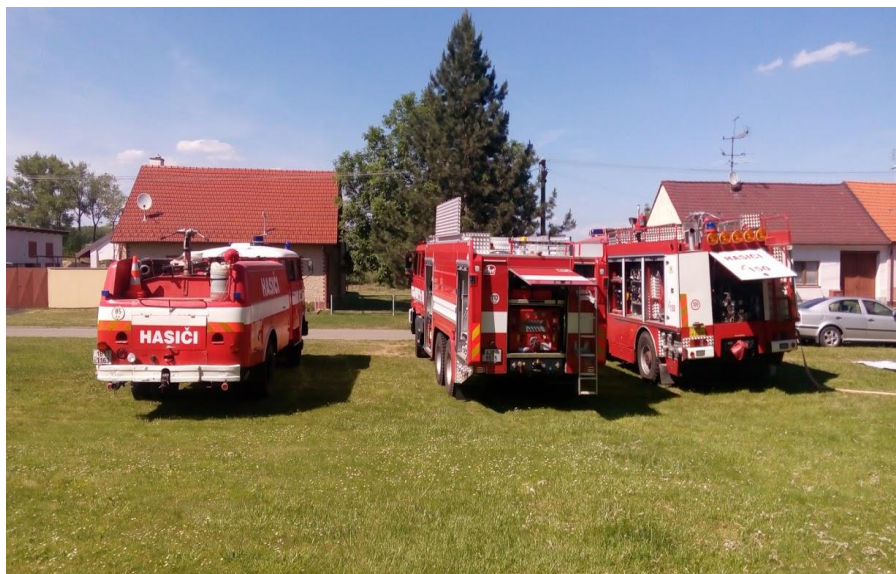
Foto: Přehlídka techniky SDH Troskotovice, SDH Rudíkov a SDH Vlasatice na dětském dni v Troskotovicích.