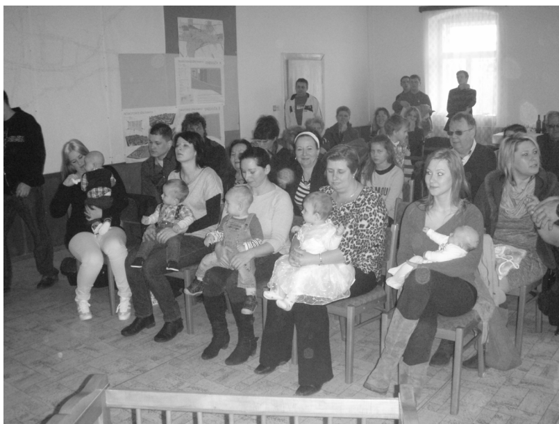
Vítání občánek