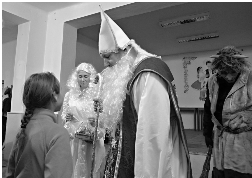
Vánoční pohádka s mikulášskou nadílkou 2014