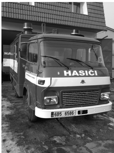
Hasičské auto SDH v Troskotovicích