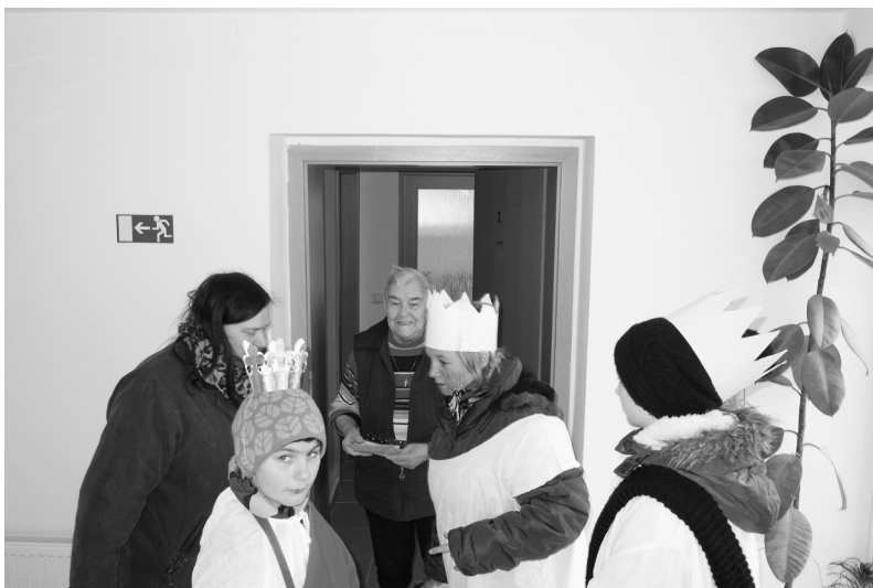
Tříkrálová sbírka