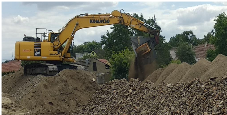
Recyklace zeminy a stavební sutí za umělkou...

Dalším důležitým počinem je nově zbudovaný přechod pro chodce mezi základní školou a farou v místě, kde je pohyb především dětí stále častější. Žádám všechny maminky a tatínky, kteří vozí své děti do troskotovických (před)školních zařízení, aby respektovali dopravní značení a předpisy, s tím související (zákaz zastavení 5m před přechodem).